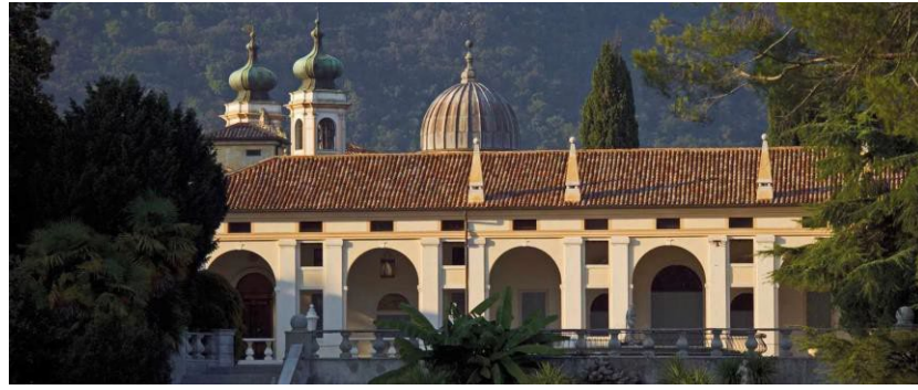
Casa di Riposo e di Accoglienza San Pio X — Romano d'Ezzelino (VI)