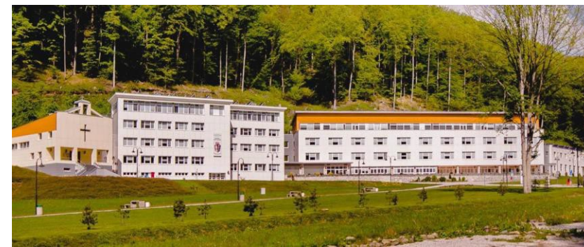
Sveti Rafael Strmac in Croazia — Croazia

Casa di riposo 65 PL Centro diurno 10 PL